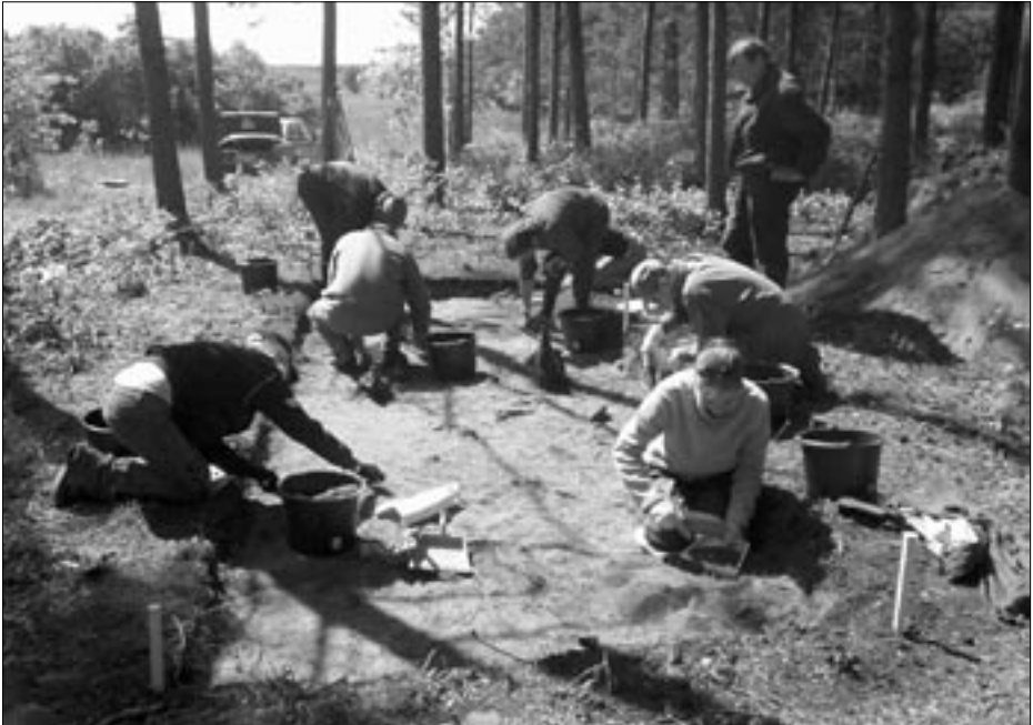
Kihnun maaperä on löyhää hiekkaa. Joukossa oleva fossiilinen kalkkikivi teki löytäjien havaitsemisen vaikeaksi.

Tutkimukset toteutettiin tasokaivauksina, etenemällä 5-10 cm tasoissa. Kaivettava maaperä oli pintaturpeen alta hiekkaa, joukossa fossiilista kalkkikiveä. Ensimmäiseltä 2x6 metrin kaivausalueelta n. 10 cm syvyydestä tuli esiin kaksi kiviladellmaa ja kappale piitä. Piikiveä ei ole Kihnulla luontaisesti. Kaivusta jatkettiin puolen metrin syvyyteen. Lisää