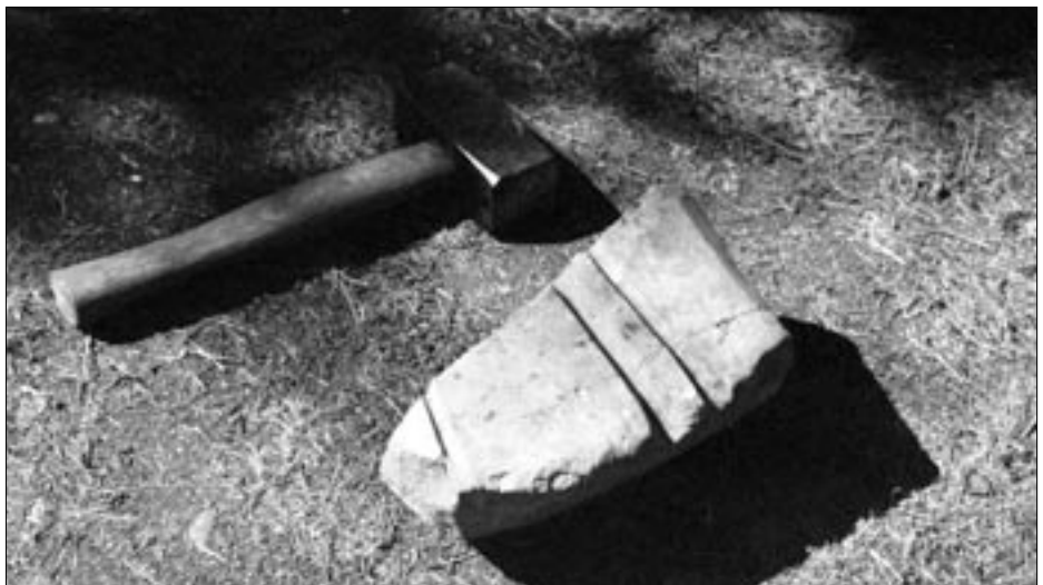
Hiomakiven toinen puolisko, vasara mittakaavanaan.

Yksi Munasaaren keramiikan paloista on ilmeisesti katkelma savi-idolin jalkaosasta. Käyrän idolin ihmiskasvot ovat kadonneet, majavan häntää muistuttava yhtenäinen jalka jäljellä. Vieressä kivinen työkalu, jonka reunassa näkyvät työstämisen jäljet.